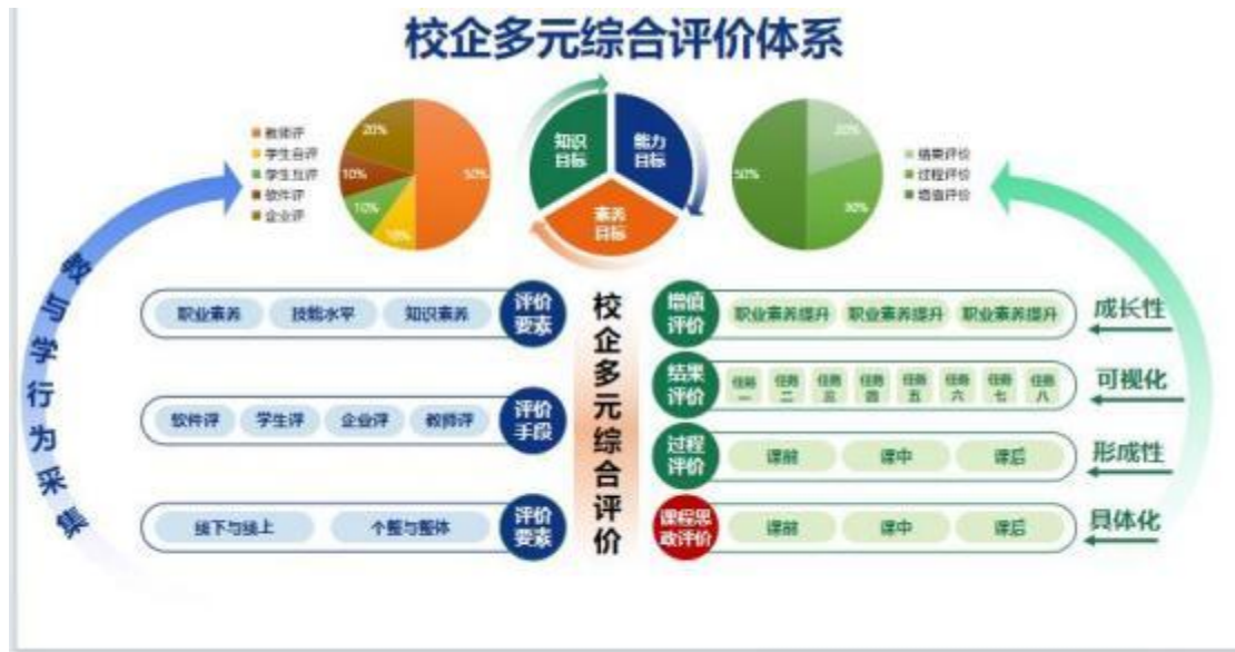
图 3 校企多元评价体系