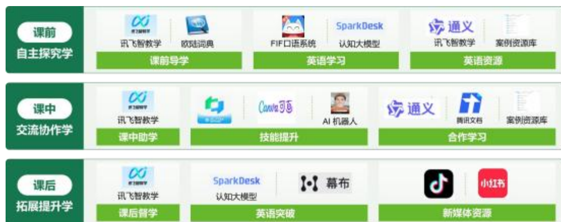
图 2 混合式教学模式教学资源（部分）

在教学评价方面，该课程采用了多元化的评价方式。线上学习评价采取网络平台评价，占总成绩的 40%，包括学生的学习时间、学习任务完成情况、参与讨论的活跃度等；线下课堂评价主体为教师、企业导师。线下课堂表现评价占总成绩的30%，主要考察学生在课堂活动中的参与度、口语表达能力、团队协作能力等；期末考试成绩占总成绩的30%，采用传统的笔试方式，考察学生对英语知识的掌握程度；多元化的评价方式全面、客观地评价了学生的学习效果。